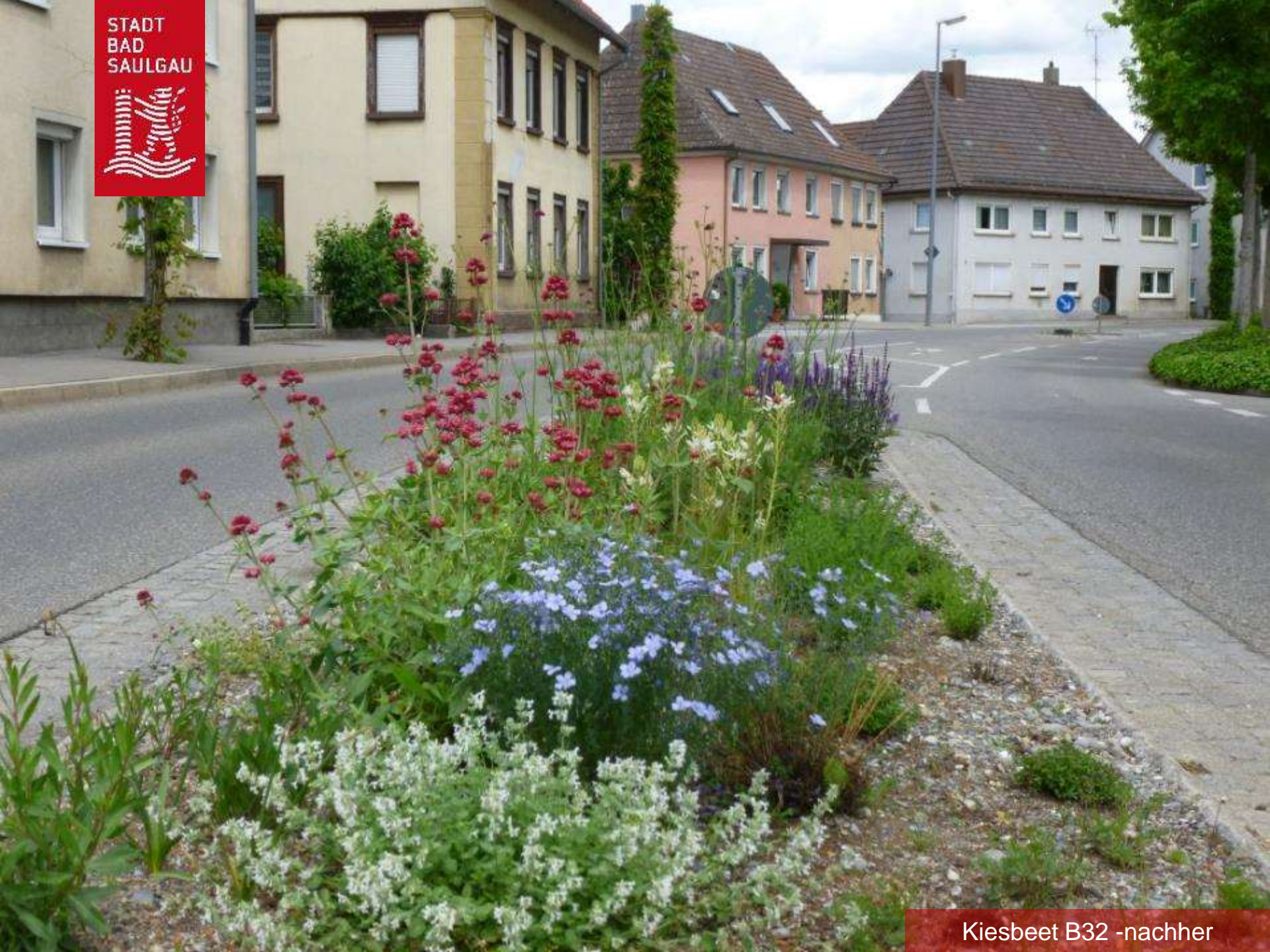
Kiesbeet B32 -nachher