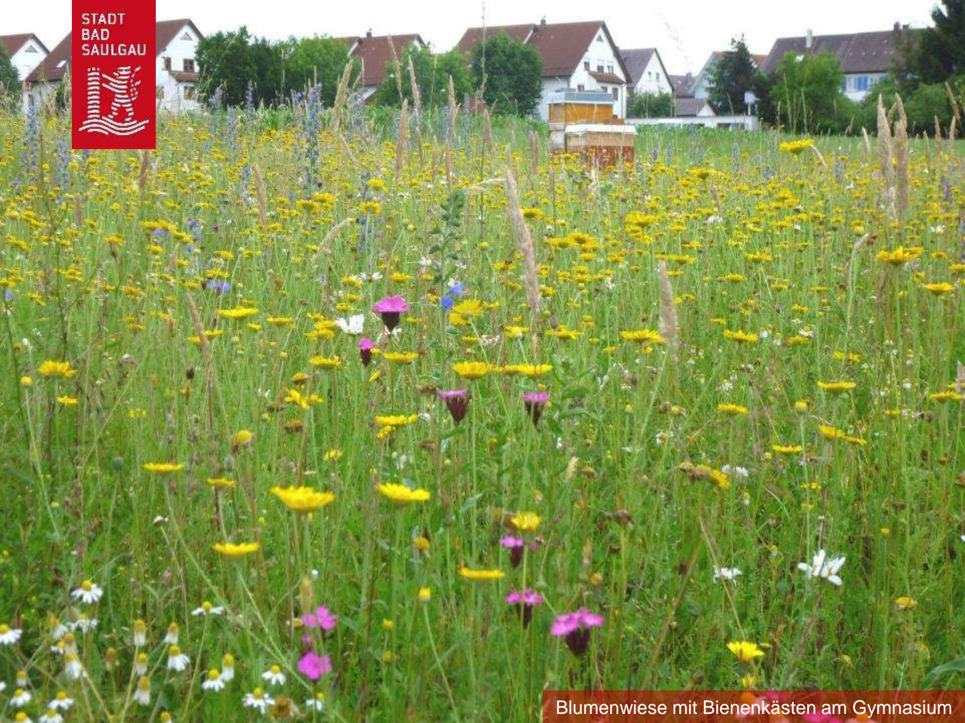
Blumenwiese mit Bienenkästen am Gymnasium