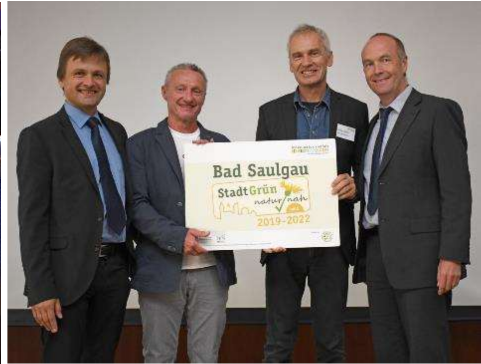
Bundessieger StadtGrün natur/nah