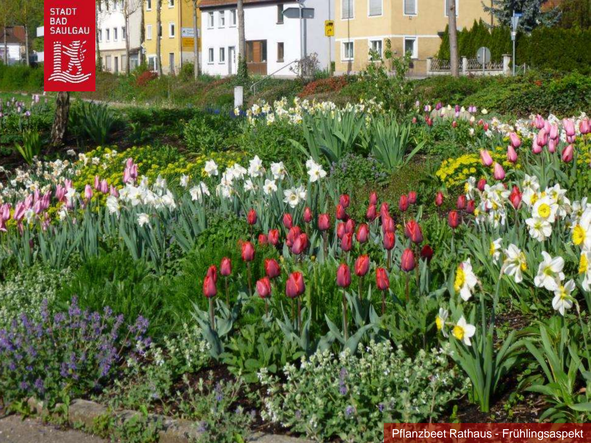
Pflanzbeet Rathaus - Frühlingsaspekt