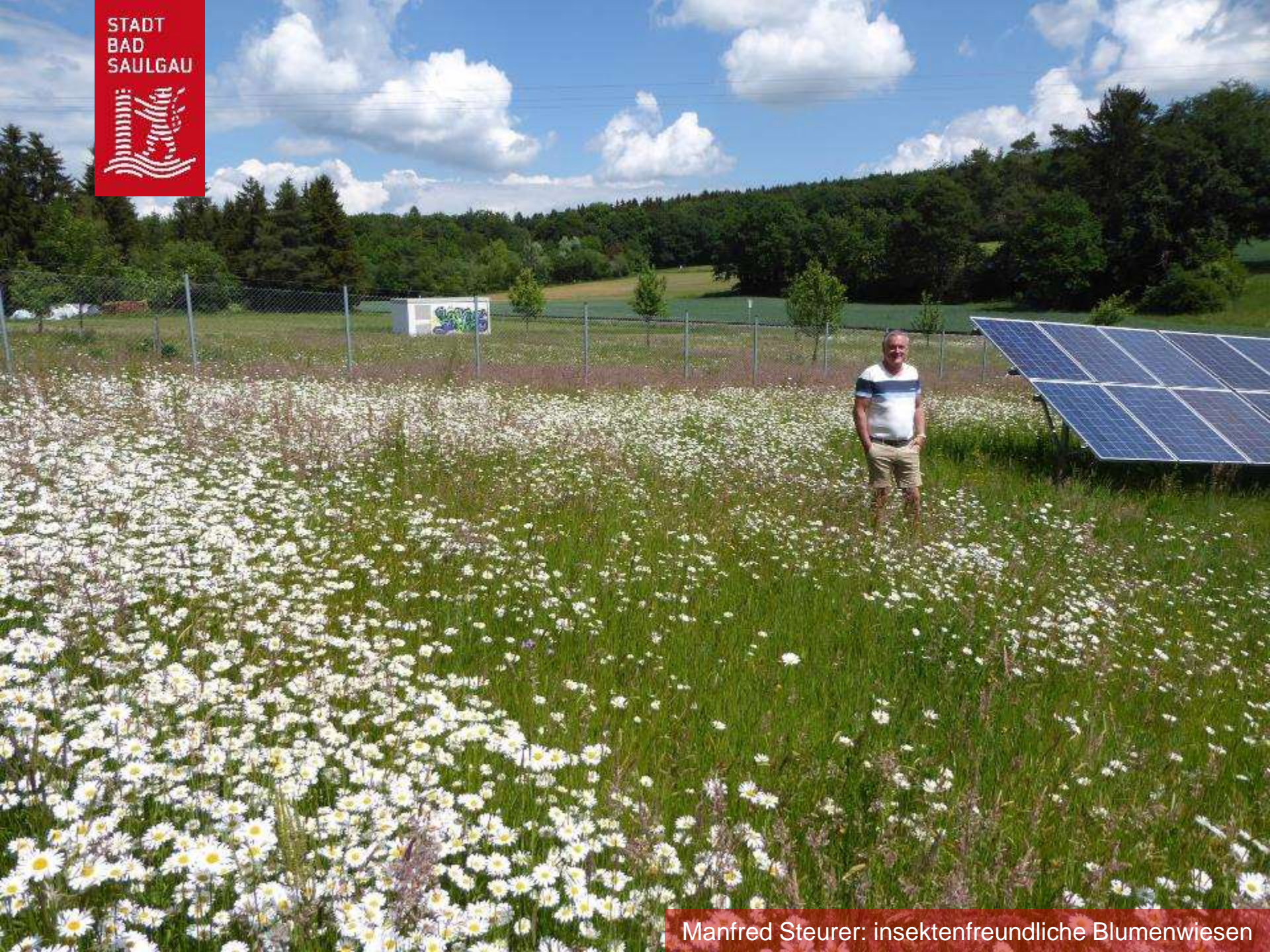
Manfred Steurer: insektenfreundliche Blumenwiesen