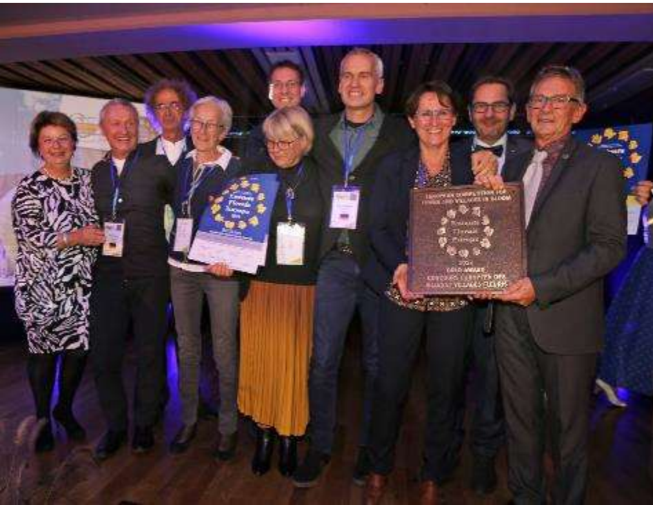
Goldmedaille Entente Florale Europe