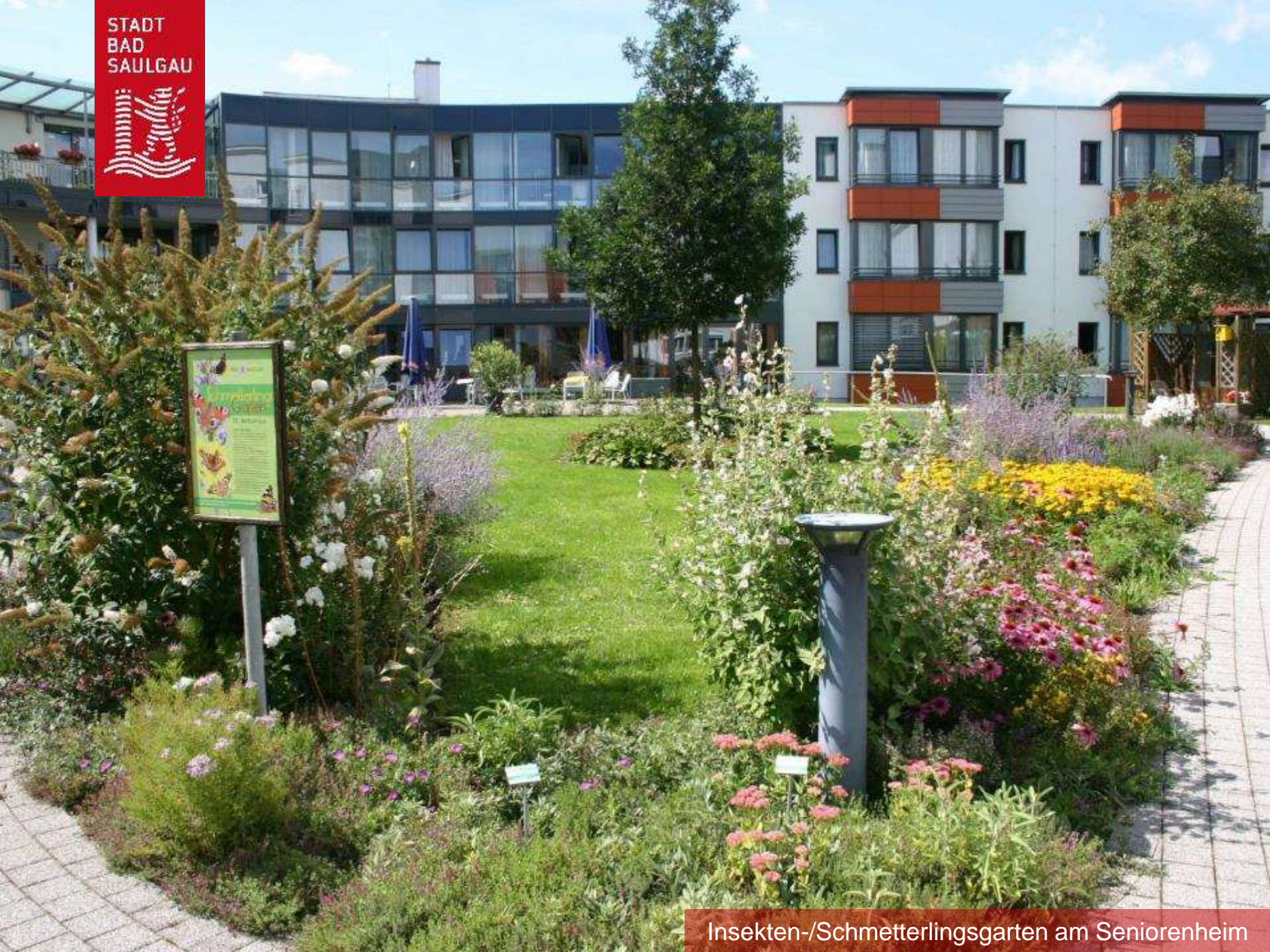
Insekten-/Schmetterlingsgarten am Seniorenheim